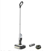
Il aspirapolvere è un elettrodomestico che serve a rimuovere la polvere e i rifiuti solidi dalle superfici piane. È composto da un motore, un serbatoio di raccolta e un tubo flessibile che si collega a un aspiratore a mano. È molto comodo e facile da usare, soprattutto in ambienti con pavimenti duri.