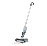
Il cordless stick vacuum cleaner è un elettrodomestico che serve a rimuovere la polvere e i rifiuti solidi dalle superfici piane. È composto da un motore, un serbatoio di raccolta e un tubo flessibile che si collega a un aspiratore a mano. È molto comodo e facile da usare, soprattutto in ambienti con pavimenti duri.