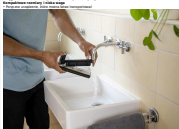
Il cordless stick vacuum cleaner è un elettrodomestico che serve a rimuovere la polvere e i rifiuti solidi dalle superfici piane. È composto da un motore, un serbatoio di raccolta e un tubo flessibile che si collega a un aspiratore a mano. È molto comodo e facile da usare, soprattutto in ambienti con pavimenti duri.