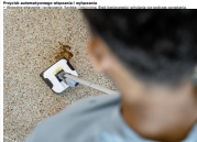
Il cordless stick vacuum cleaner è un elettrodomestico che serve a rimuovere la polvere e i rifiuti solidi dalle superfici piane. È composto da un motore, un serbatoio di raccolta e un tubo flessibile che si collega a un aspiratore a mano. È molto comodo e facile da usare, soprattutto in ambienti con pavimenti duri.